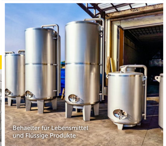
Behälter für Lebensmittel und Flüssige Produkte

PERFEKT FÜR DIE MISCHUNG VON MATERIALIEN!