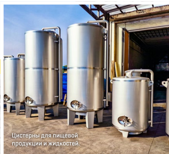
Цистерны для пищевой продукции и жидкостей.