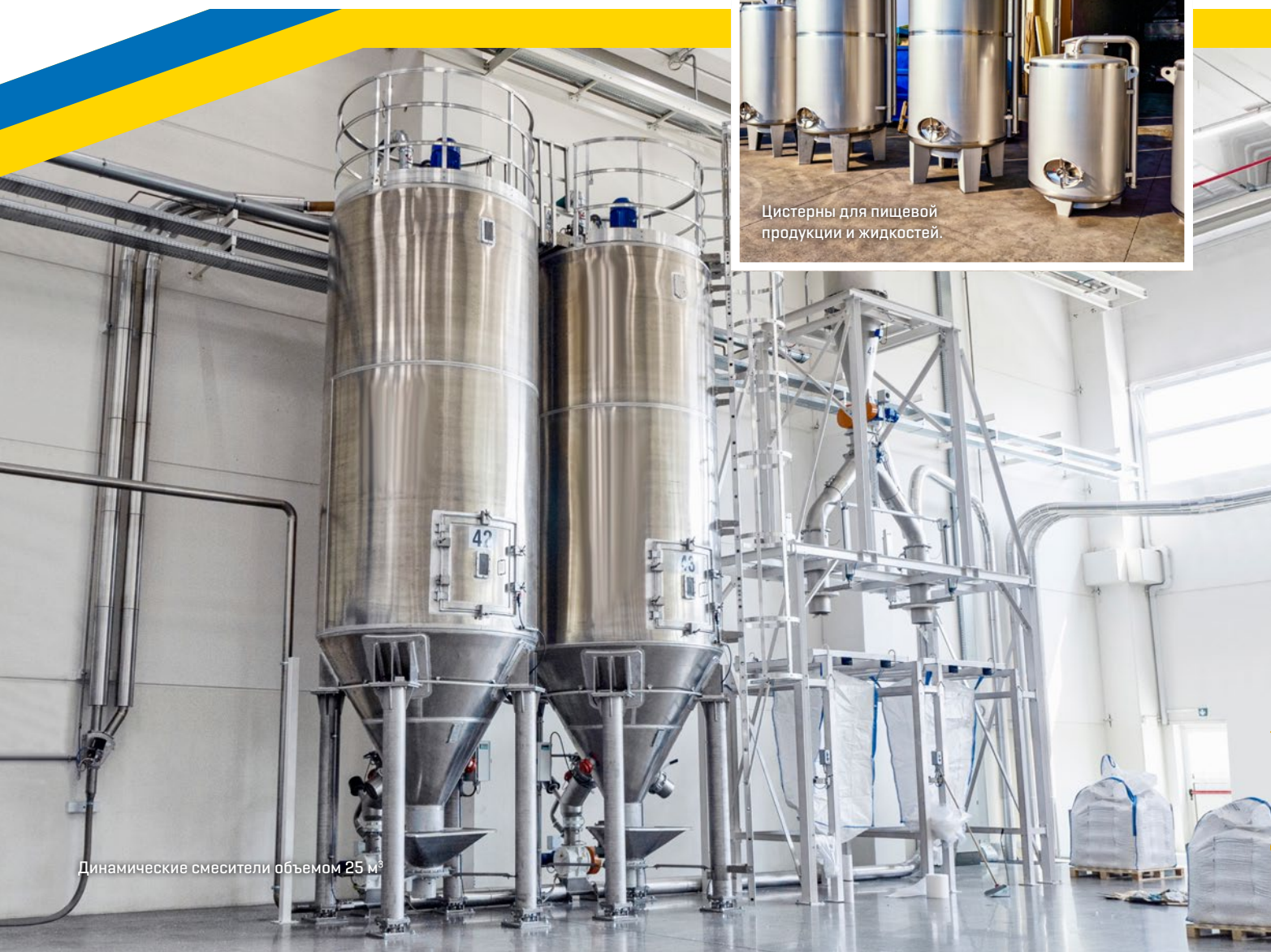
Динамические смесители объемом 25 м³